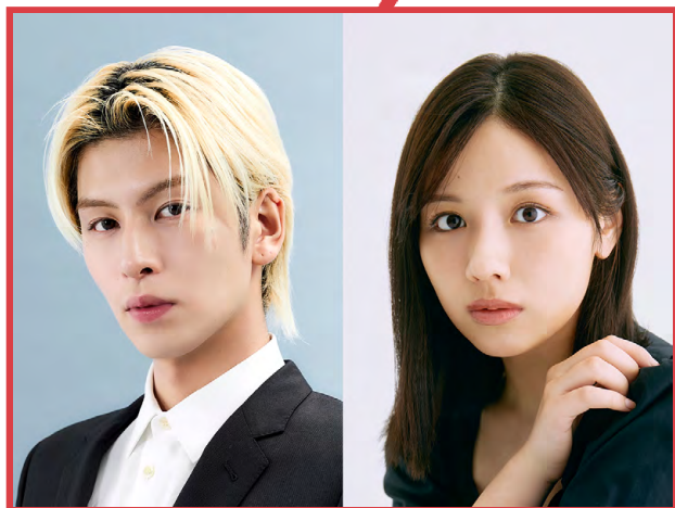
長谷川慎 & 渡邊美穂 (THE RAMPAGE)