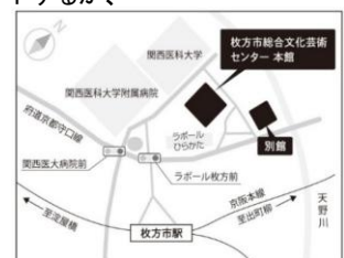
◎京阪電車「枚方市」駅から徒歩約5分