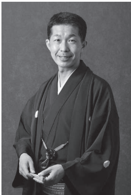
柳家 三三 りゅうけい さんざん

江戸落語界の中でも、人気・実力の高いトップランナーたちで構成した特選会。 持ち味の異なる演者による芸の競演をたっぷりとお楽しみください。