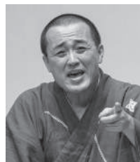
桂そうば かっら そうば

大阪府茨木市出身。平成6年11月故桂吉朝に入門。平成10年NHK新人演芸大賞新人賞受賞。平成25年文化庁芸術祭優秀賞受賞・花形演芸大賞受賞。平成26年文化庁芸術選奨文部科学大臣新人賞受賞。