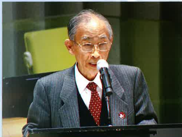
講演者 はま すみ じ ろ う 濱住 治郎氏 ノーベル平和賞受賞 日本被団協事務局長代行

広島で母の胎内にいる時に被爆。2003年に東京都稲城市原爆被爆者の会を結成。2015年に日本被団協の事務局次長に就任。2024年ノーベル平和賞授賞式(オスロ)参加。2025年3月、核兵器禁止条約の第3回締約国会議(国連・NY)で核廃絶を訴え、国連本部での「胎内被爆」スピーチは94か国・地域の共感を得て世界に反響を呼んでいる。