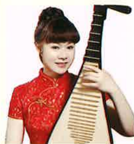
中国琵琶奏者 閻杰(エンキ)