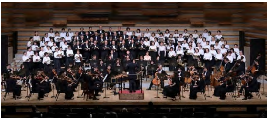
2024 年 10 月創立 45 周年記念公演 ハイドン：オラトリオ「四季」

入団に選考はありません。当初、楽譜を読めなかった方も入団しています。入団締切は 5 月末。 それ以降は楽譜を読める方のみ相談させていただきます。詳細は当団ホームページか、西川まで お問合せください。西川 090-8126-1167 macnishi2003@yahoo.co.jp