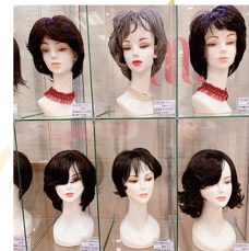
ファッション用/医療用ウィッグ マーム 枚方店