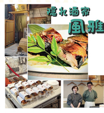
焼き鯖寿司 隠れ酒家 風雅