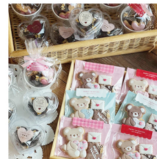
アイシングクッキー 小さなお菓子工房miyumiyu