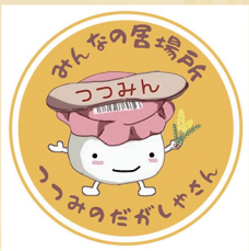
駄菓子 つつみの駄菓子屋さん