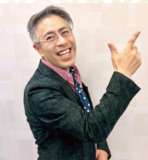
枚方ギフトブランド くらわんかファブリック