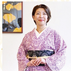
伊勢型紙・伊勢木綿・伊勢茶 華結椿会 栗山橙花