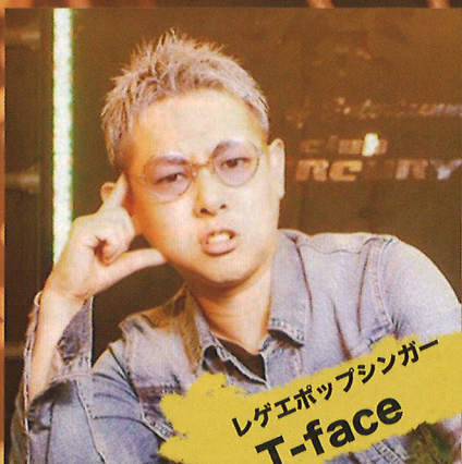
レゲエポップシンガー T-face

無音と音楽のある表現で ろう者・聴者問わず誰もが楽しめる 視覚的な世界観を創り出します。