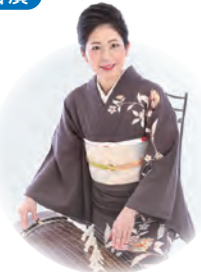
邦楽界だけでなく洋楽界でも活躍する箏奏者 片岡リサ [箏]