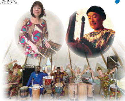
10年以上に渡り関西を中心に活動 アフリカダンス&ドラム・トライブス [打楽器など]